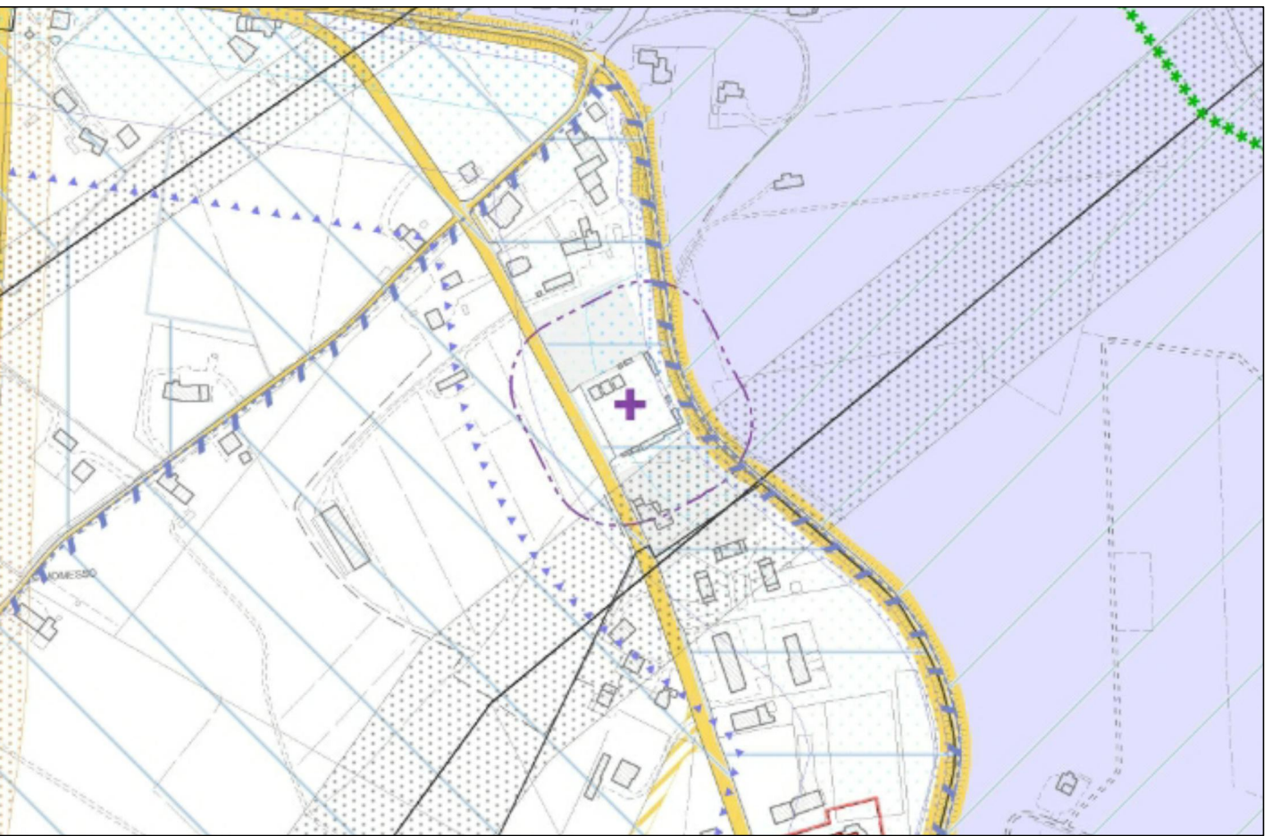
ESTRATTO P.I. Novembre 2017 - Tav.1.1 C - Carta dei Vincoli e della Pianificazione Territoriale - scala 1:5.000