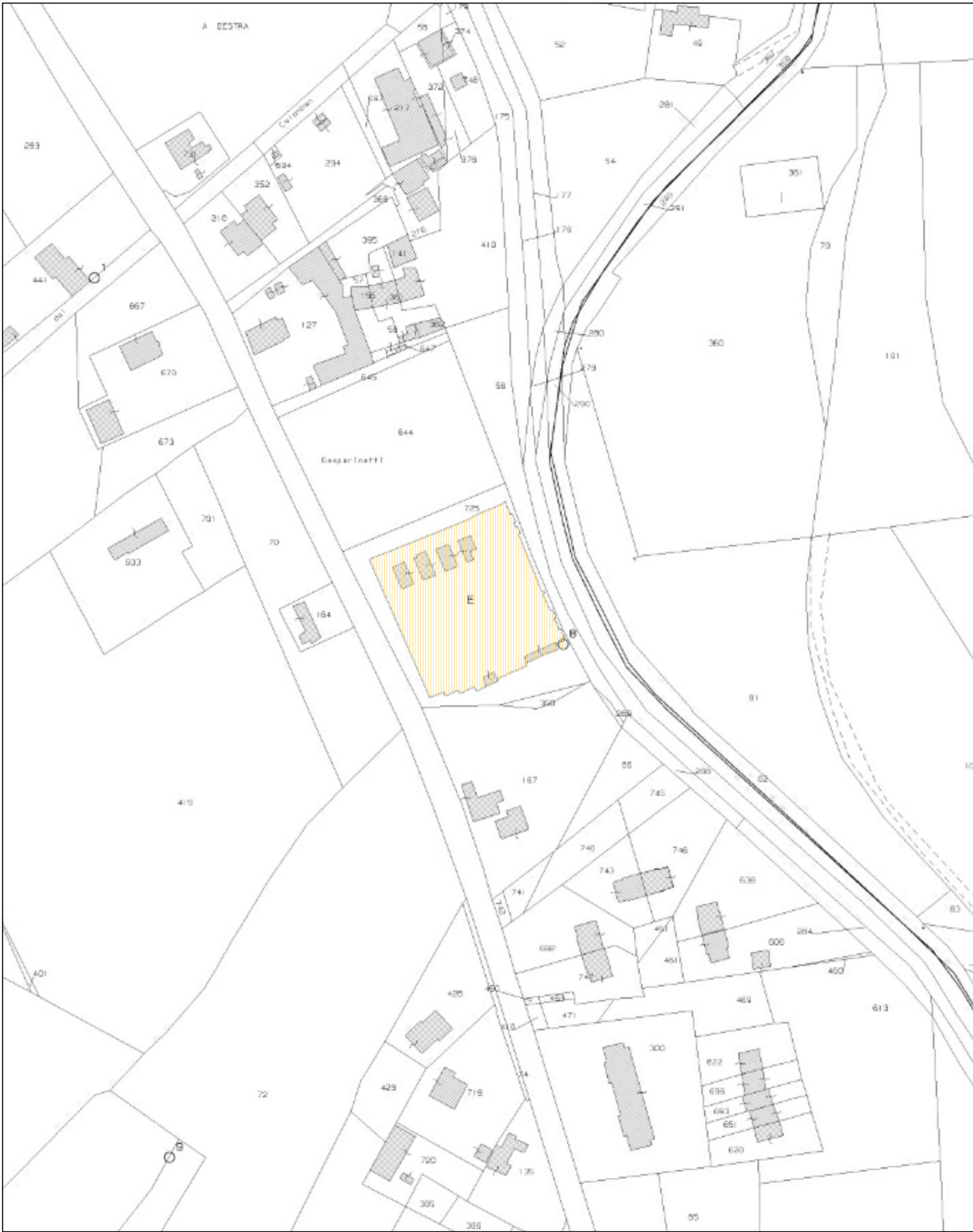
ESTRATTO DI MAPPA - scala 1:2.000 Comune di San Biagio di Callalta, Foglio 8, mapp. E, 725, 350