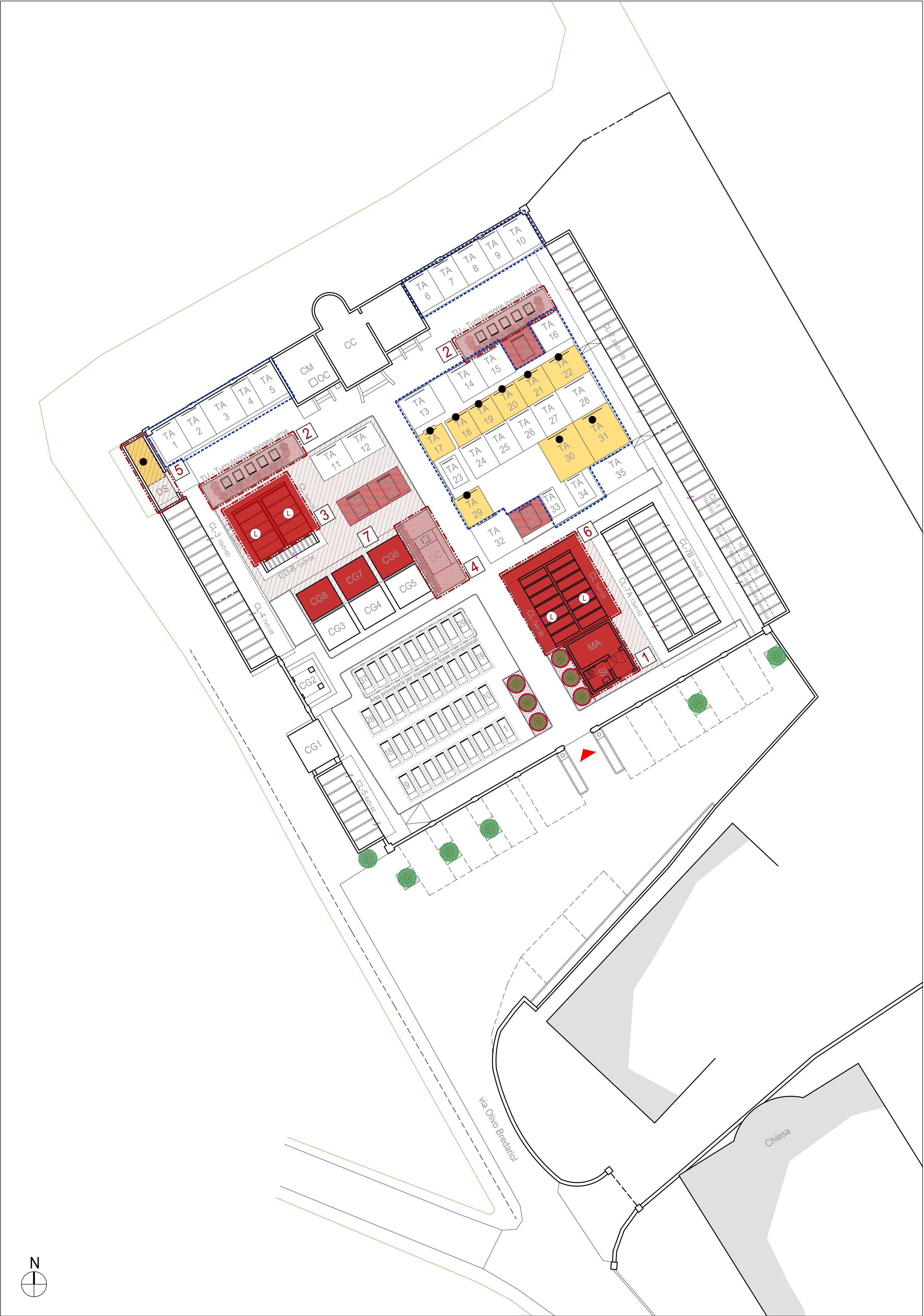
PLANIMETRIA GENERALE - INDIVIDUAZIONE INTERVENTI - Scala 1:200